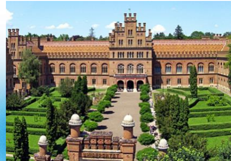
Czerniowiecki Uniwersytet Narodowy im. Jurija Fedkowycza