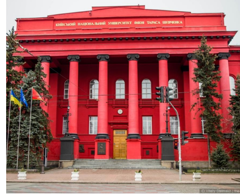
Kijowski Uniwersytet Narodowy im. Tarasa Szewczenki