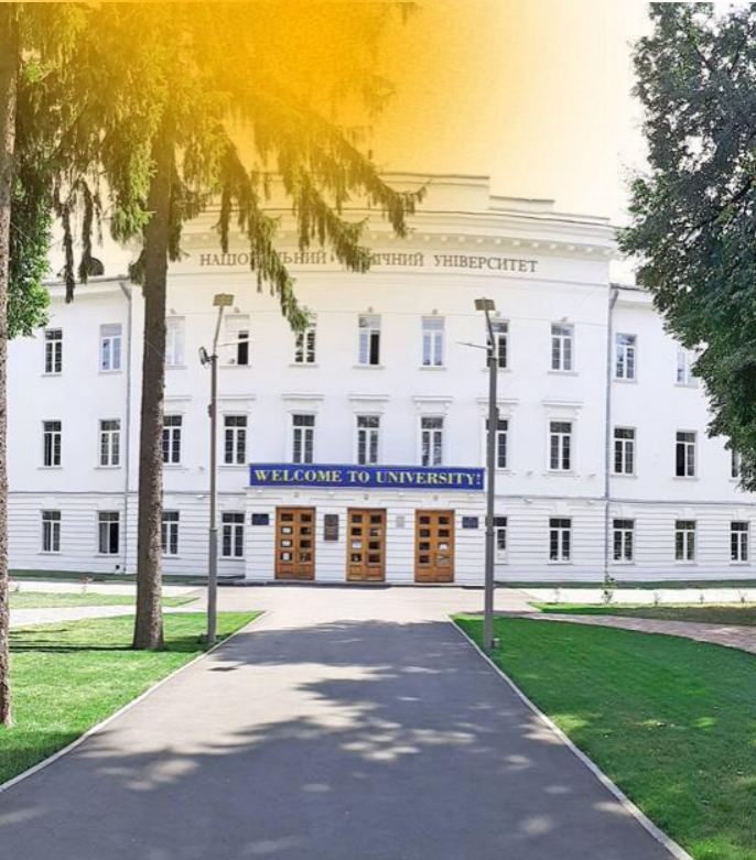
Uniwersytet Narodowy "Politechnika Połtawska im. Jurija Kondratiuka"

Instytucje edukacyjne działają w 14 regionach, głównie w formie nauczania na odległość 50% Uczelnie wznowiły naukę na odległość, reszta nie może pracować z powodu okupacji lub zniszczenia miast