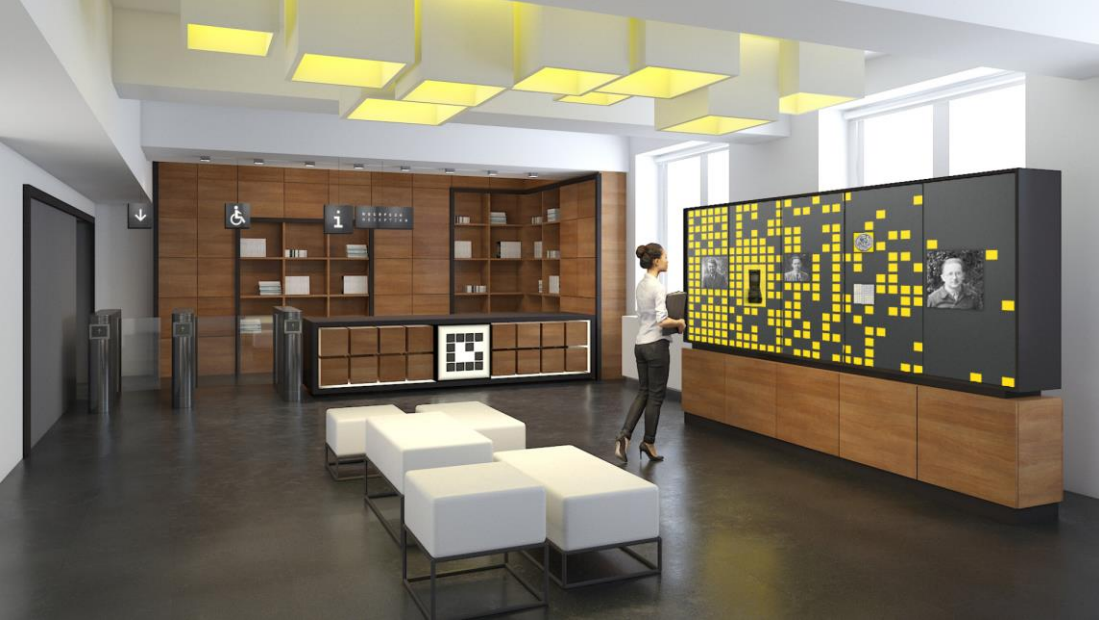
Centrum Szyfrów Enigma