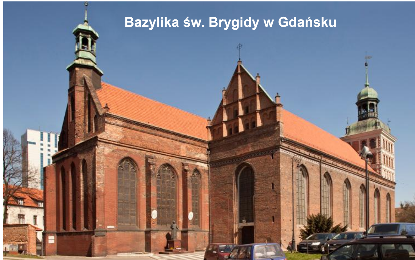
Bazylika św. Brygidy w Gdańsku