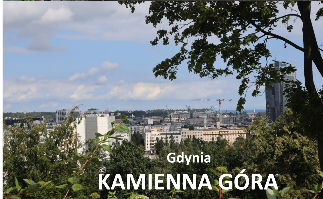
Gdynia KAMIENNA GÓRA