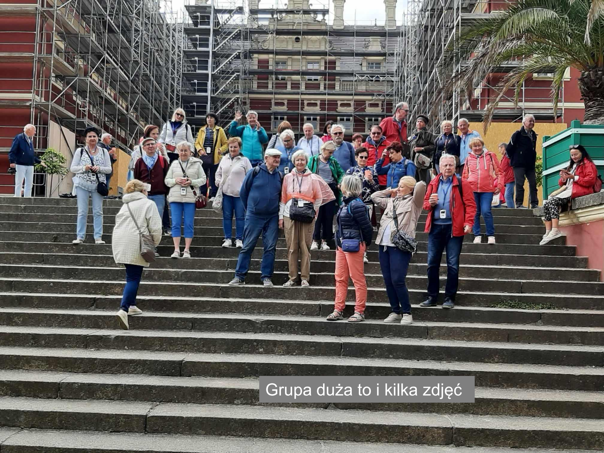
Grupa duża to i kilka zdjęć